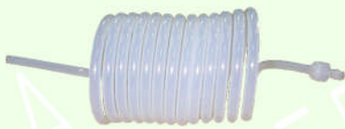
インチサイズ コイルチューブ

プロセスで使用する、機器の設計・製作を行います。 既製品がない、仕様がぴったり合わない、などの不満を解消いたします。